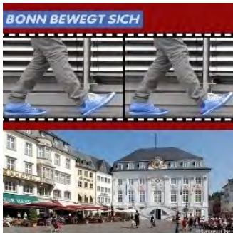
Ratsbilanz CDU & GRÜNE 2014

Die CDU-Ratsfraktion begrüßt, dass immerhin vier Interessenten für das sogenannte Nordfeld des Bahnhofsvorplatzes (Bereich zwischen dem Bonner Loch, der Thomas-Mann-Straße und dem Grundstück an der Bahnlinie) nun Pläne vorgelegt haben.