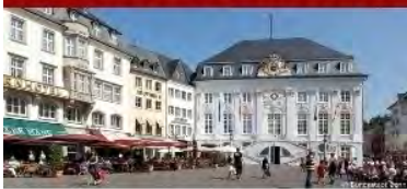
Ratsbilanz CDU & GRÜNE 2014

Die Koalition hat einen umfangreichen Rechenschaftsbericht über ihre erfolgreiche Ratsarbeit verfasst, der auf der Bilanz-Homepage www.bonn-bewegt-sich.de einzusehen ist und dort auch um Download bereit steht.